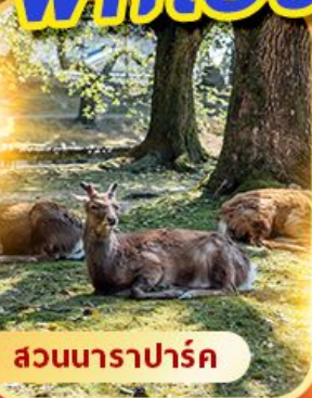
สวนนาราปาร์ค