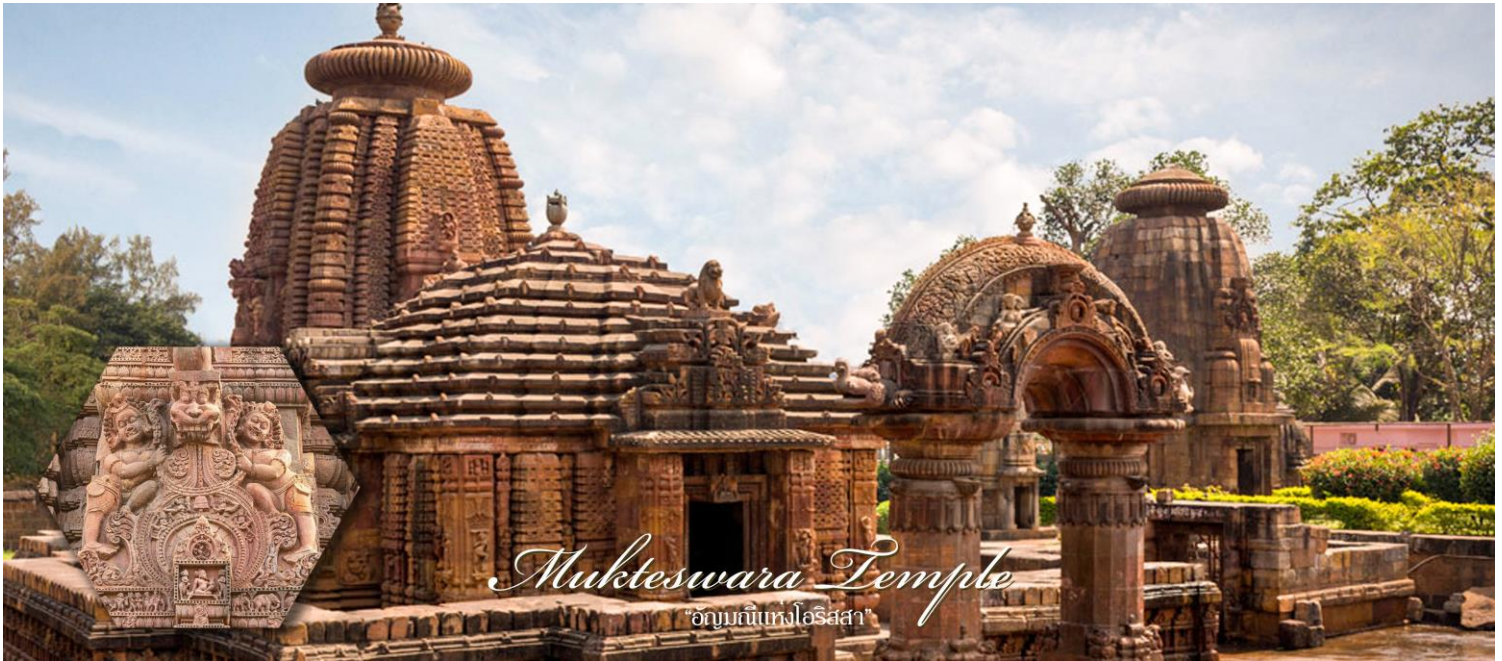
Mukteswara Temple "อนุสรณ์แห่งโอริสสา"

นำท่านเยี่ยมชม พิพิธภัณฑ์ Orissa State Museum เป็นที่รวบรวมประวัติศาสตร์และรวบรวมพระพุทธศาสนาจากสถานที่ต่างๆทางโบราณคดีและประวัติศาสตร์ของนครโอริสสา