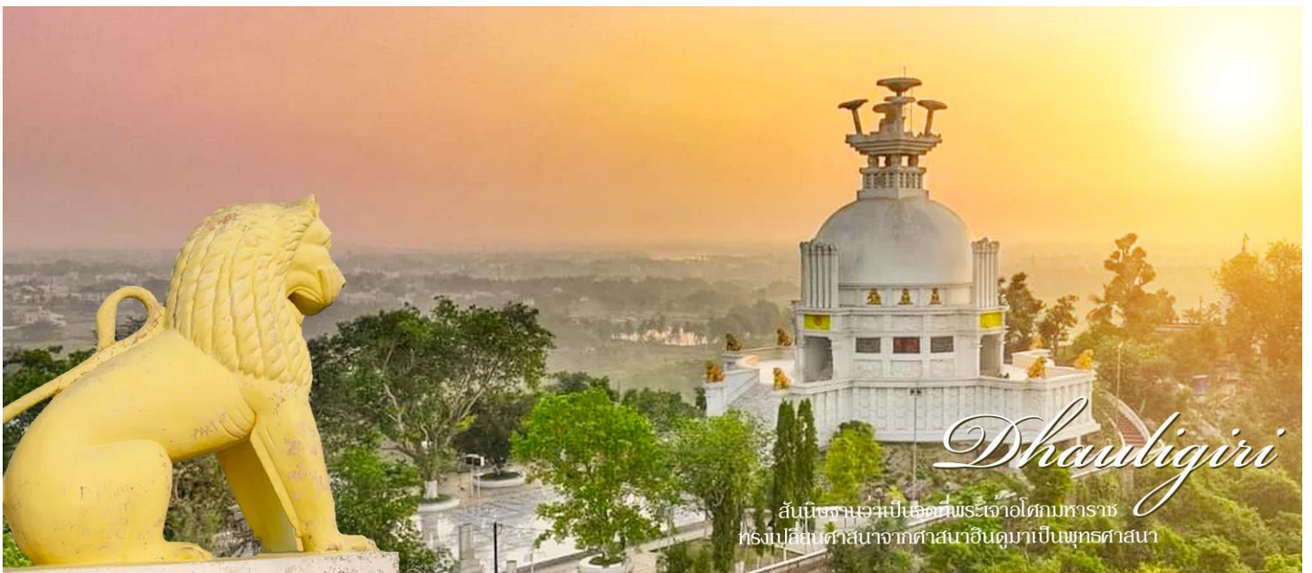
Dhauligiri "อนุสรณ์แห่งโอริสสา"

นำท่านเยี่ยมชม พิพิธภัณฑ์ Orissa State Museum เป็นที่รวบรวมประวัติศาสตร์และรวบรวมพระพุทธศาสนาจากสถานที่ต่างๆทางโบราณคดีและประวัติศาสตร์ของนครโอริสสา