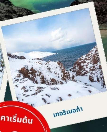
เทอริเบอก้า