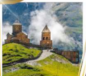
โบสถ์เกอร์เกตี