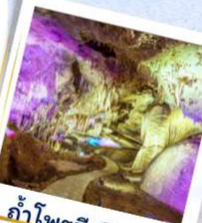
ถ้ำโพรมีเทียส