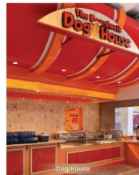
Dog House DOG HOUSE