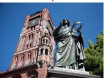
เมืองโตรุน