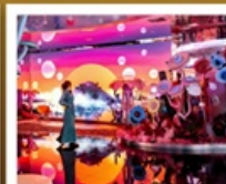
EDCC YIYUN DIGITAL ART