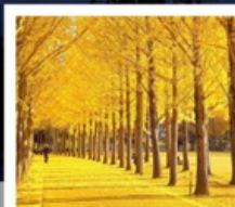
สวนเอ๊กชิโป