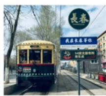
นั้งรกรางดางซุน