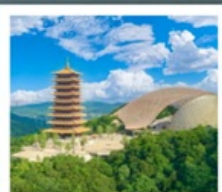
ภูเขาหนิวไ่ส่วซาน

อุทยานทะเลสาบไท่หู (รวมล่องเรือ) ถนนคนเดินซานตง • วัดจี้หมิง ถนนอุ้งงูต้าเต้า • ห้างสรรพสินค้าเต๋อจี้ ภูเขาหนิวไ่ส่วซาน (รวมรถกอล์ฟ) สะพานแม่น้ำแยงซีเกียงนานกิง • ทะเลสาบเซวียนอู่ หมู่บ้านเหนียนฮวาวัน • โรงงานเซรามิกเถาเอ้อด่าง เมืองโบราณเหย่าหู (รวมรถไฟเล็ก) • คุณซาน ถนนโบราณปาอิง • North Bund Green Land STARBUCKS RESERVE ROASTERY THE LOUIS • ถนนหวยไห่ (SONG MONT)