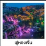
ฟูหรงเจิน