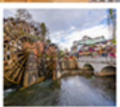
ເມືອງໂບຣານສີ່ເຈີຍງ