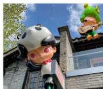
ถนนคนเดินชอยกว้างแคว