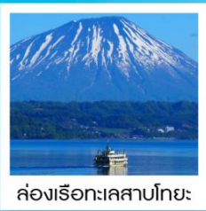
ช่องเรือทะเลสาบโทยะ