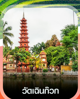
วัดอินทก๊วก

✈️ คอนเฟิร์มออกเดินทาง ทุกพีเรียด 2 ท่านขึ้นไป