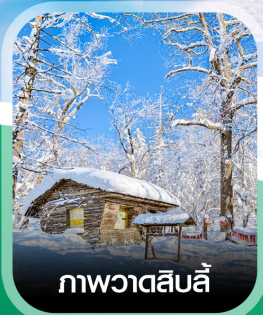
ภาพวาดสีบลู