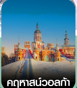
คฤหาสน์วอลก้า