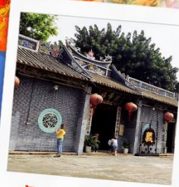
วัดกวนอูเซินเจิ้น