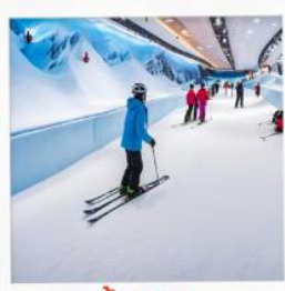
บ้านหิมะ WINDOW OF THE WORLD