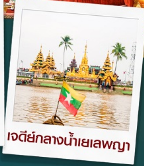
เจดีย์กลางน้ำเยเลพญา