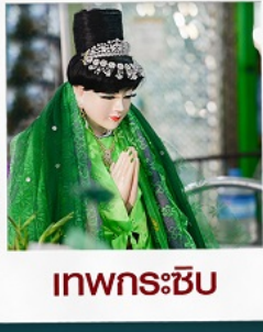
เทพกระเซิบ