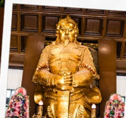
วัดเขกงหมิว