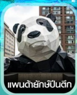
แพนด้ายักษ์ป็นตีก