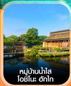
หมู่บ้านน้ำใส โอชิโนะ ฮักไก

✈️ คอนเฟิร์ม ออกเดินทาง ทุกพีเรียด 2 ท่านขึ้นไป