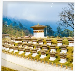
จุดชมวิวดาซูล่า