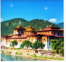
พูนาคาซอง