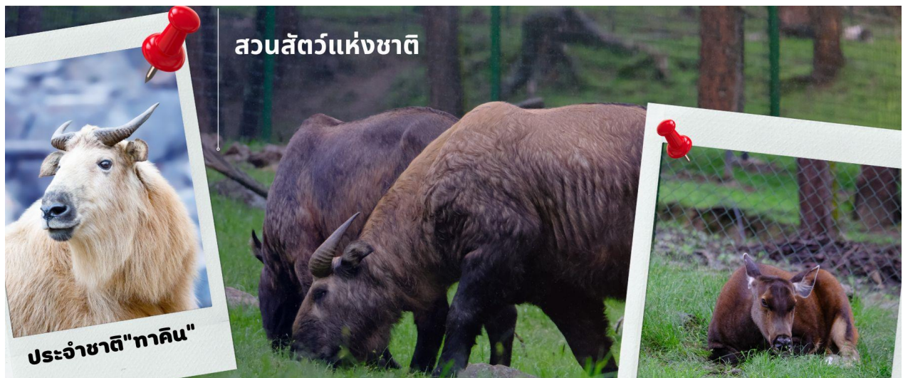
ประจำชาติ"ทาคิน"

เที่ยง รับประทานอาหารเที่ยง ณ ภัตตาคาร (มือที่ 7) นำท่านชม สวนสัตว์แห่งชาติของประเทศภูฏาน และชมสัตว์ประจำชาติ ทาคิน ที่มีรูปร่างลักษณะพิเศษผสมระหว่างแพะกับวัว มีแห่งเดียวในประเทศภูฏานเท่านั้น ซึ่งครั้งหนึ่งประเทศสหรัฐอเมริกาเคยเจรจาของไปเลี้ยงแต่ได้รับการปฏิเสธจากรัฐบาลประเทศภูฏาน ทาคิน เป็นสัตว์ในตำนานประวัติศาสตร์ของศาสนาพุทธ โดยเชื่อว่าท่านลามะ Drukpa Kunley เป็นผู้สร้างขึ้นจากกระดูกของแพะและวัวที่ท่านได้ทานเป็นอาหาร กองกระดูกก็กลับมามีชีวิตอีกครั้งกลายเป็น ตัวทาคิน ที่มีลักษณะคล้ายกับแพะและวัวผสมกัน