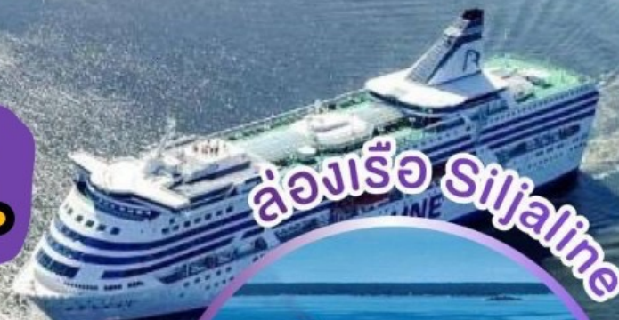
ล่องเรือ Siljaline