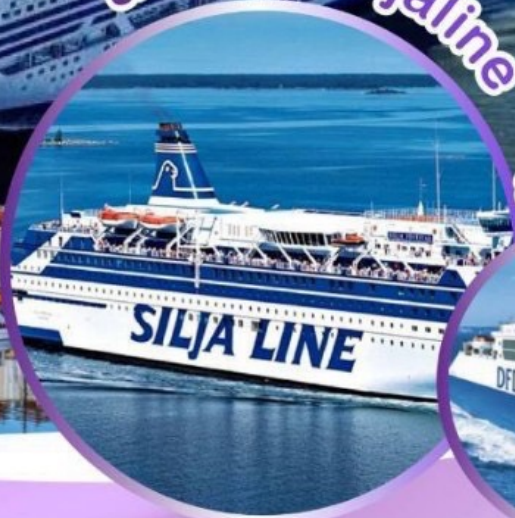
ออกเดินทางปี 2024