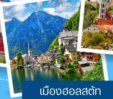
เมืองฮอลสตัดท์