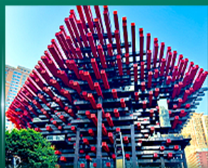
เขื่อนตึกตะเกียบ