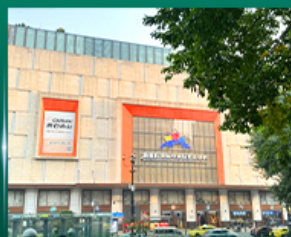
ศูนย์การค้าส่งเสื่อฟ้าไฟไฟสโตร์