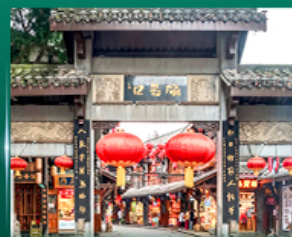
หมู่บ้านโบราณฉิวฉิว