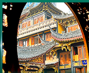
วัดพรวิฑลว้ฉัน