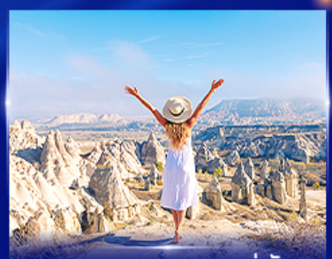
ชมความงดงาม หุบเขาแห่งรัก