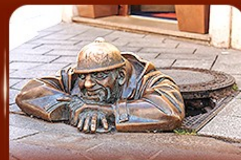
แลนด์มาร์คดัง รูปปั้นคูนิล Bratislava