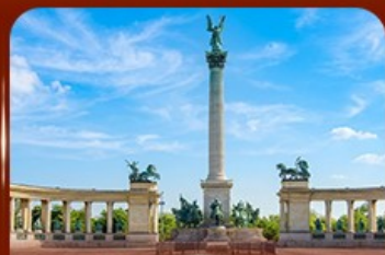
จัตุรัสวีรบุรุษ บูดapest