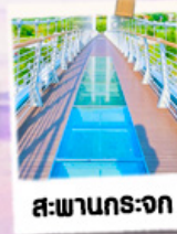
สะพานกระจก