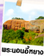
พระนอนอภัย