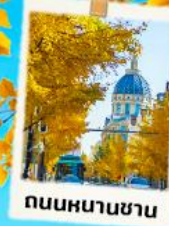
ถนนหนานชาน