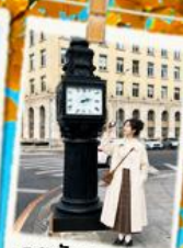
จตุรัสวงชาน