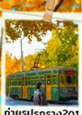
ถ่ายรูปปรตราง201