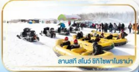
ลานสกี สโนว์ ฮักไซฟาโนรามา