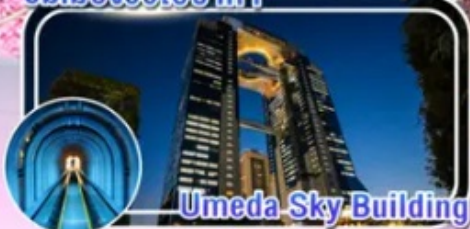
Umeda Sky Building