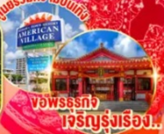
ศูนย์รวมความบันเทิง