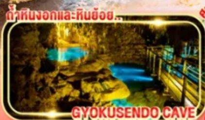
ถ้ำหินงอกและหินย้อย