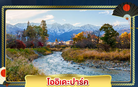
โออิวะเคะปาร์ค