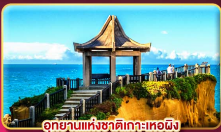
อุทยานแห่งชาติเกาะเหอผิง

ชมพลุข้ามปี ฉลองเทศกาลปีใหม่ 2027 แช่น้ำแร่ส่วนตัวในห้องพัก