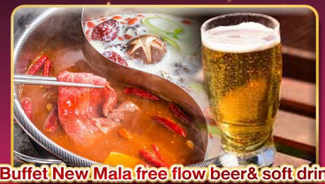
*Buffet New Mala free flow beer & soft drink