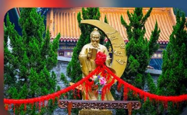
วัดหวังคัาเซียน