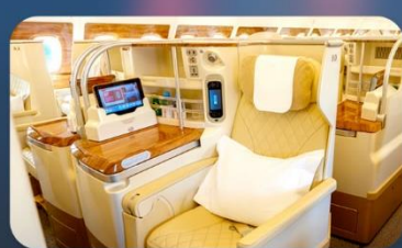
BUSINESS CLASS "บินกลับ"