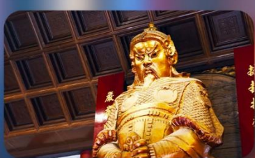
วัดแซงทมิว

THE LUXE MANOR HOTEL หรือเทียบเท่า 4-5 ดาว