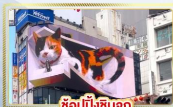
ซุปป์ชินจูกุ