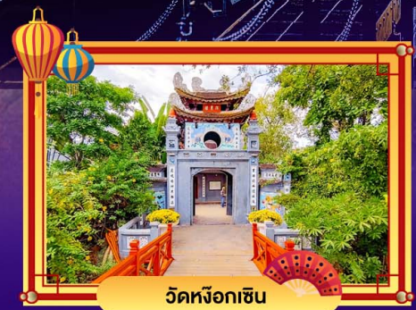
วัดหิ่งห่อ