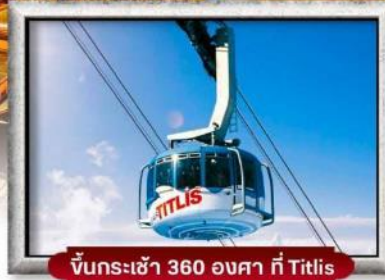
ขึ้นกระเช้า 360 องศา ที่ Titlis