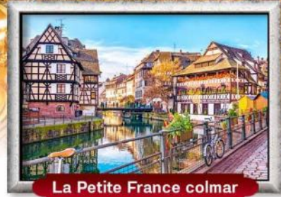
La Petite France colmar

บินหรู สายการบิน Full Service | พิเศษ! หอยแอสคาโก้