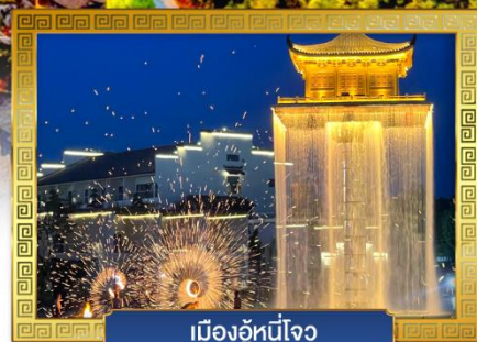
เมืองอุ๋หนี่โจว