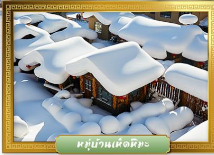
หมู่บ้านเห็ดหิมะ