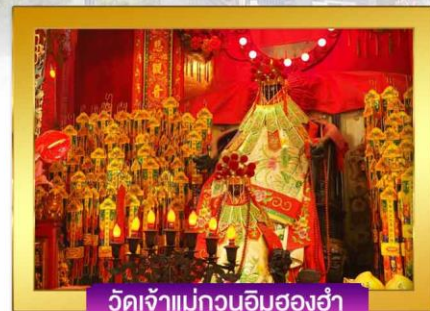
วัดเจ้าแม่กวนอิมฮองฮ่า