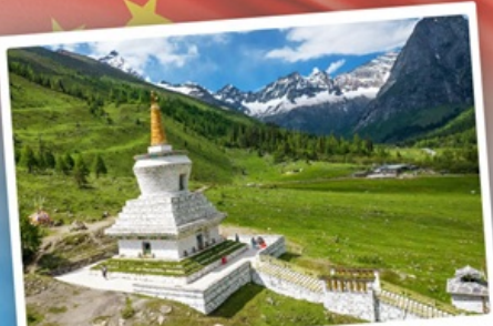
กู๋เจาสีครุณี

เที่ยว 2 อุทยาน กู๋เจาสีครุณี & ปี้ฝิงโกว เดินชมหมีแพนด้าสุดน่ารัก ใกล้ชิดกับแพนด้าแดง