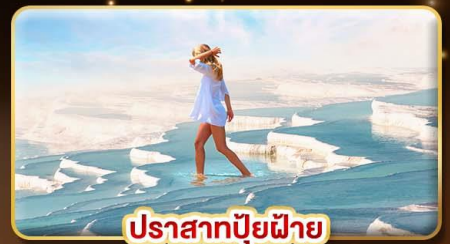
ปราสาทบิวเฝีย