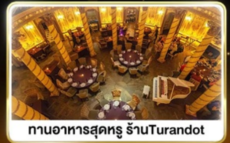
ทานอาหารสุดหรู ภัตตาคารTurandot