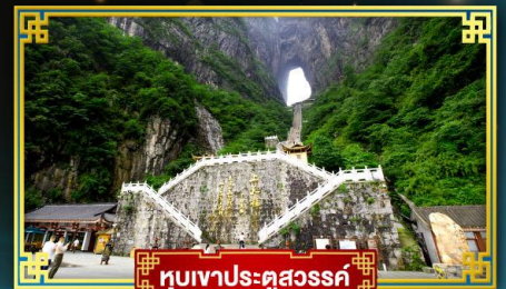
ทิวเขาประตูสวรรค์