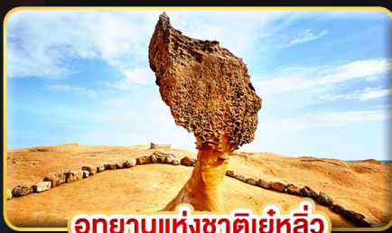
อุทยานแห่งชาติเย่หลิว