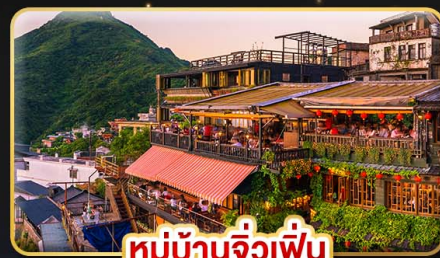
หมู่บ้านจิวเฟิ่น