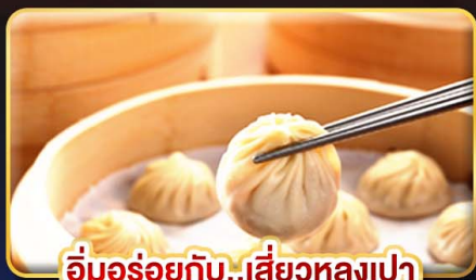
อ๋มอร่อยกับ..เสี่ยวหลงเปา

พิเศษ !! หม้อนึ่งจักรวาล, ไอศกรีม MIYAHARA