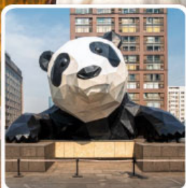
หมีแพนด้ายักษ์ป็นตึก