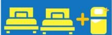
เตียง 3 ก้น ที่นอนเสริม TRIPLE