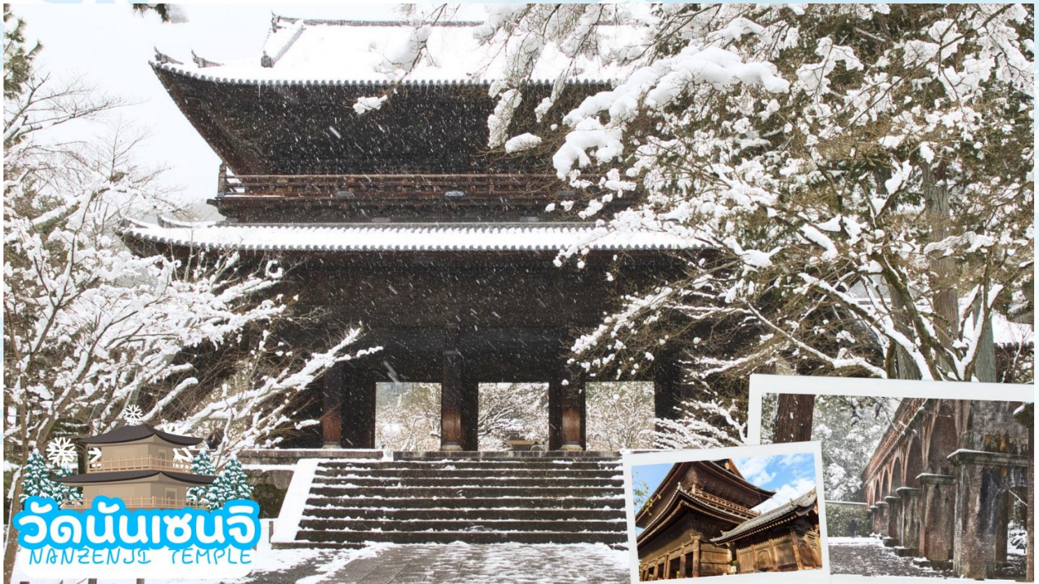
วัดนันเซนจิ NANZENJI TEMPLE

กลางวัน รับประทานอาหารกลางวัน ณ ร้านอาหาร (มื้อที่ 1)