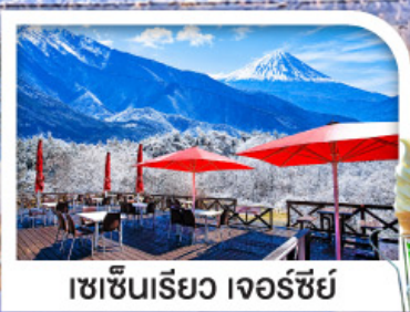
เซชินริเยว เจอร์ซีย์

หมู่บ้านมรดกโลกชิราคาวาโกะ | ชมวิวฟูจิ ริมทะเลสาบคาวากูจิ เซชินริเยว เจอร์ซีย์ ระเบียงชมวิวภูเขาไฟฟูจิและเทือกเขาแอลป์