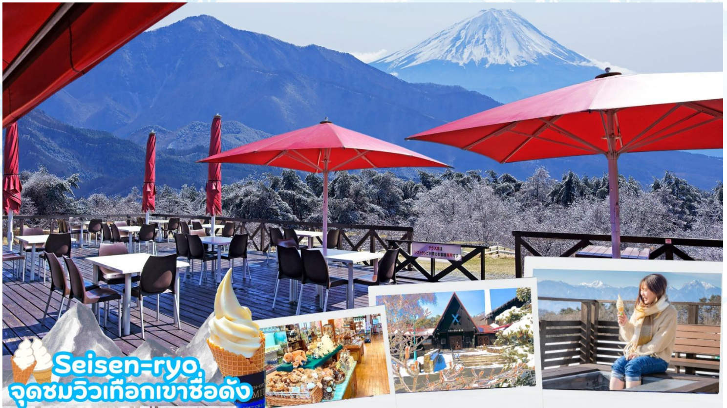
Seisen-ryo จุดชมวิวเทือกเขาฮิดัง

เมืองโฮคุโตะ (Hokuto) ตั้งอยู่ทางตะวันตกเฉียงเหนือของจังหวัดยามานาชิ เป็นเมืองที่ล้อมรอบไปด้วยภูเขาสูง เช่น ภูเขาýtสี่งาตาเกะ เทือกเขาแอลป์ตอนใต้ ภูเขาคินบุ และภูเขาคายะงาตาเกะนอกจากนั้นยังสามารถเห็นวิวที่สวยงามของภูเขาไฟฟูจิได้อีกด้วยมีทรัพยากรธรรมชาติที่มีคุณภาพ ไม่ว่าจะเป็นน้ำแร่ เมล็ดข้าว และผลิตภัณฑ์จากนมวัว